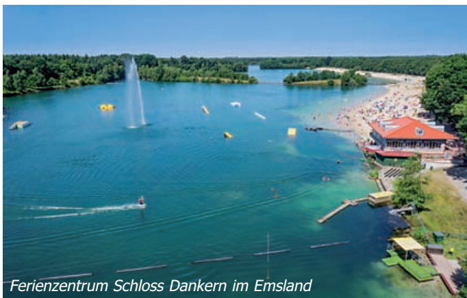
Ferienzentrum Schloss Dankern im Emsland

Man stelle sich vor, man lebt mit vier Freunden – die Mädchen natürlich mit Freundinnen – und einem netten Team eine Woche lang in einem Ferienhaus.