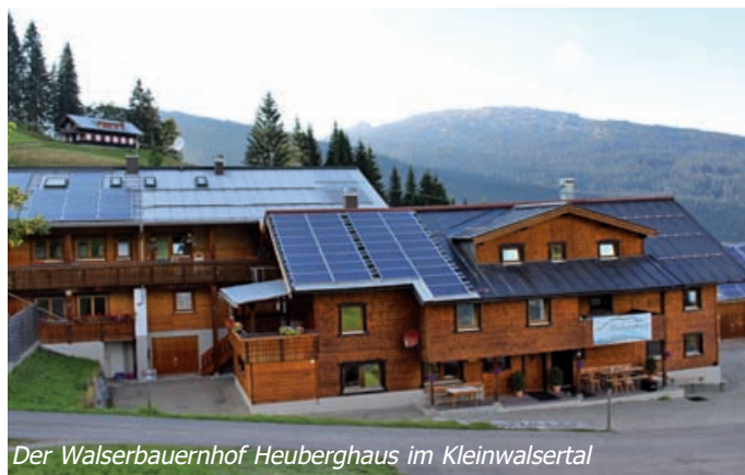
Der Walserbauernhof Heuberghaus im Kleinwalsertal

Das Haus bietet vom 10. bis 15. Juni 2019 Platz für 53 Jungen und