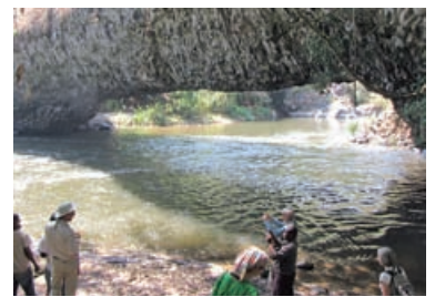
Pfr. i.R. Eckhart Hauff; Walter Süß

gründete Selbsthilfegruppen, um mit ihnen auf Märkten über die Krankheit zu informieren und Menschen zum Test zu motivieren. Aus diesen Selbsthilfegruppen entstand der Film „Just like you“ – Menschen wie du und ich“. Der Film zeigt Eindrücke aus dem Leben der Menschen mit HIV-Aids in Tansania.