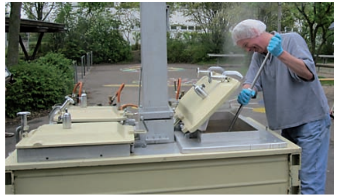
Die Feldküche in Göggingen ist am 1. Mai unverzichtbar.

Er hat Tradition und wird vor allem von zahlreichen Mai-Wanderern geschätzt – der AKG-Erbseneintopf, der jedes Jahr am 1. Mai ab 11.30 Uhr auf dem Vorplatz der Riedlenschule in Göggingen angeboten wird. Die Mitglieder des Akkordeon-Klubs Göggingen kochen ihn in der „Feldküche“ nach altem Hausrezept und in der vegetarischen Variante. Auch Grillwurst und Pommes Frites stehen auf der Speisekarte. Nachmittags gibt es Kaffee und hausgemachte Kuchen. Eine Wanderung nach Göggingen lohnt sich auch kulinarisch!