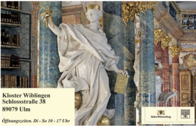
Kloster Wiblingen Schlossstraße 38 89079 Ulm