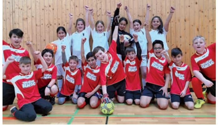
Kicker der Sägefild-Schule Wiblingen

Tanja Leger-Pfisterer Boschstraße 8/1 - 89079 Ulm bewerbung@ib-bauer-partner.de – www.ib-bauer-partner.de