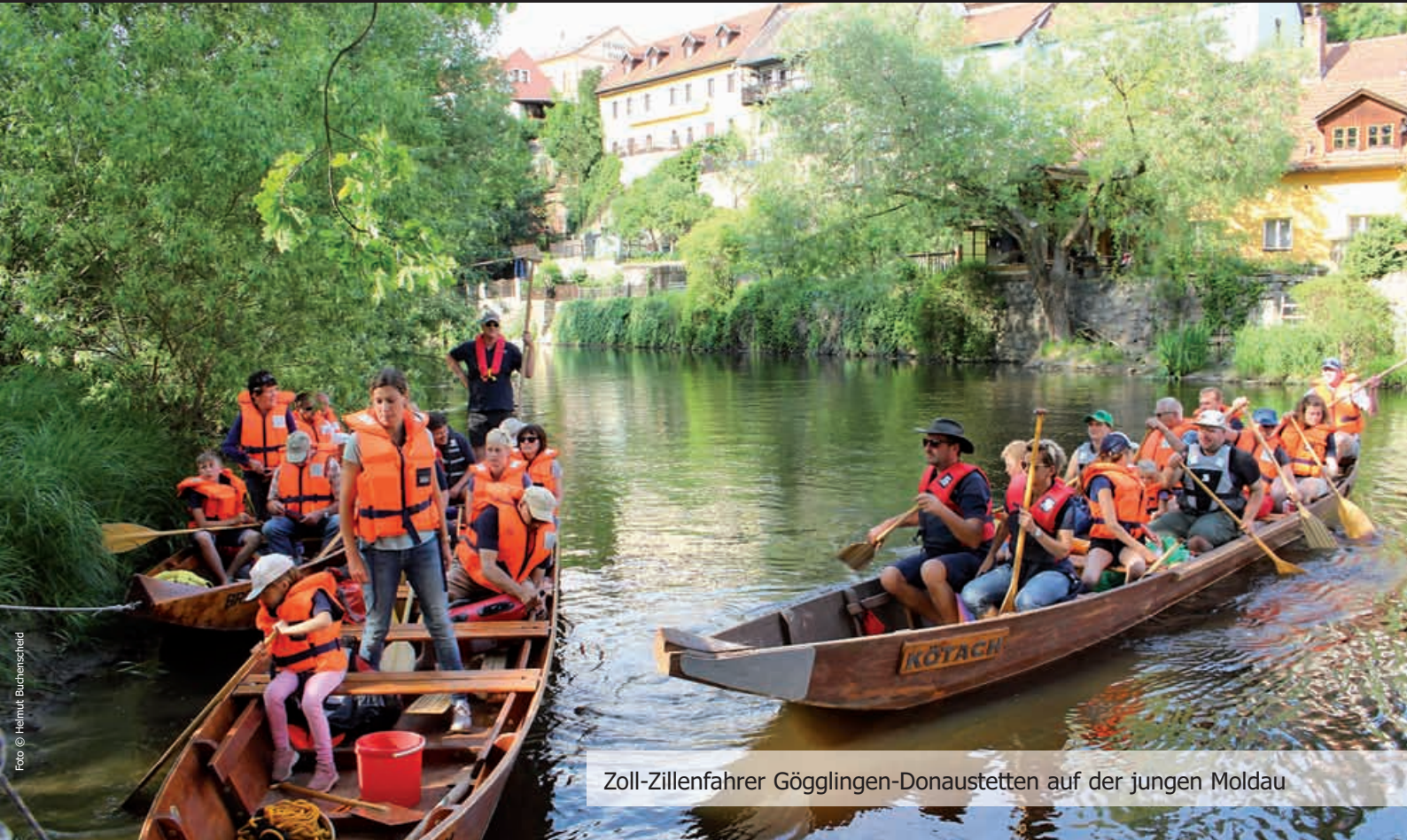
Zoll-Zillenfahrer Göggingen-Donaustetten auf der jungen Moldau

Offizielles Mitteilungsblatt der Regionalen Planungsgruppe Ulm-Wiblingen