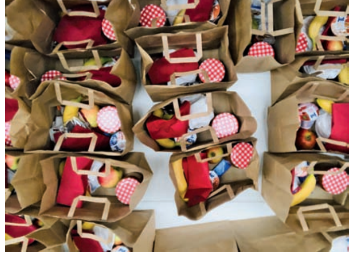
Die fertigen Tüten „Adventstafel to go“

An liebevoll gedeckte Tische zum Mittagessen in St. Franziskus oder an Begegnungen beim anschließenden Kaffee mit Gebäck im Foyer der Zachäus-Gemeinde war aber nicht zu denken.