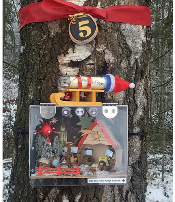
Familie Heinold (Krippe Nr. 5)