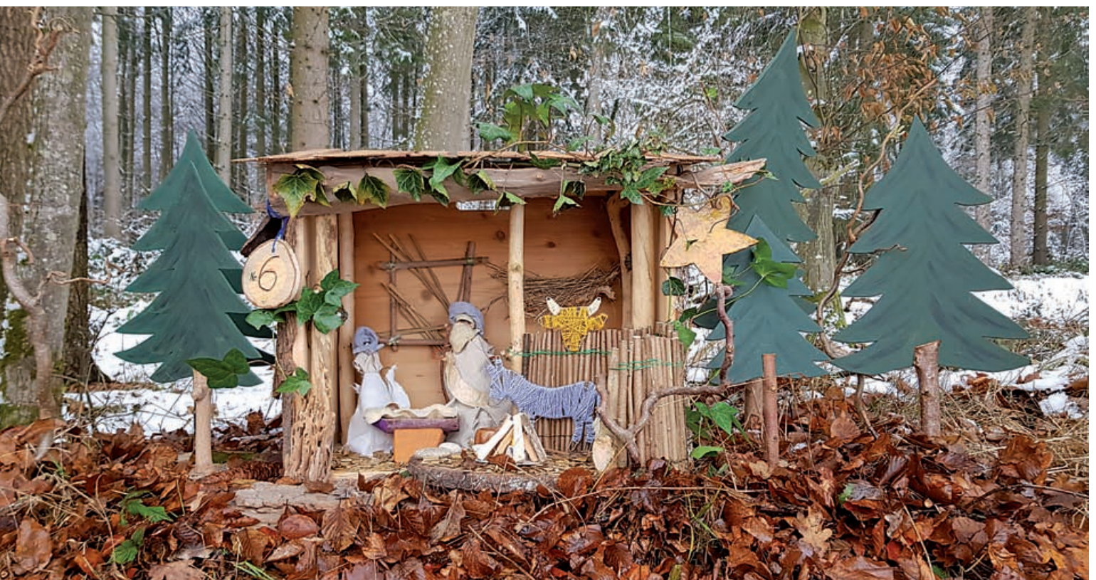
Günter Heuchel (Krippe Nr. 6)