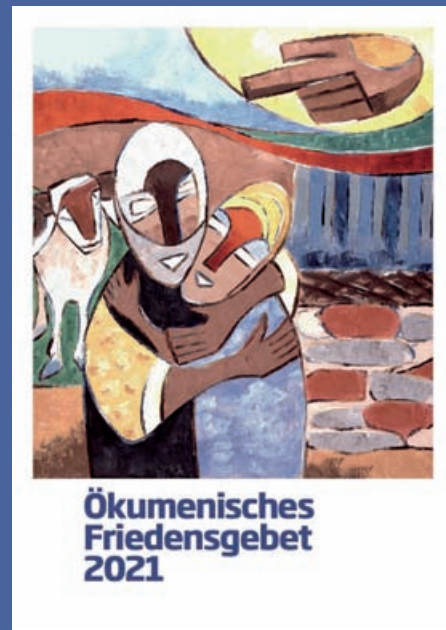
Bild: Kolawole Olajinka, „Abraham und Isak“ - 1997

Wecke in meinem Herzen ein neues Gefühl der Ehrfurcht vor allem Leben.