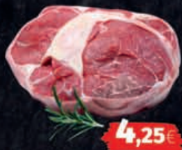
Frische Rinder-Beinscheiben Herkunft: laut Auszeichnung 1kg