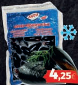
Ganze Miesmuscheln tiefgefroren 1kg Beutel