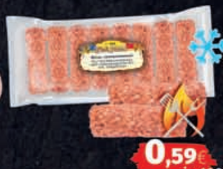
Mici Hackfleischröllchen roh, tiefgefroren ca 670g Packung - 1kg = 5,85€