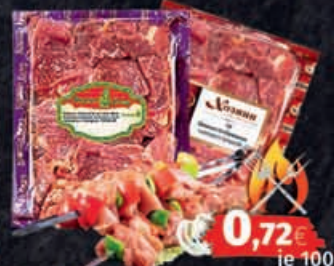
Schaschlik aus Schweinefleisch oder Hühnerfleisch ca 1150g Packung - 1kg = 7,15€