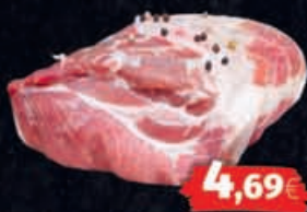
Frischer Schweine-Hals ohne Knochen, 1kg