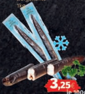
Europäischer Aal, heißgeräuchert und ausgenommen, tiefgefroren 1kg = 32,50€