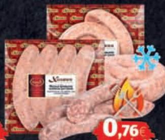
Bratwurst „Hausgemacht“, oder „Derewenskaja“, ca 450g Packung - 1kg = 7,55€