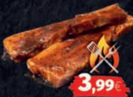
Schweine-Bauch, mariniert 1kg