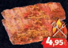
Schweine-Schälrippen mariniert, 1kg