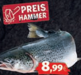
Frischer Lachs Herkunft: laut Auszeichnung 1kg