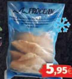
Rotbarschfilets tiefgefroren 1kg Beutel