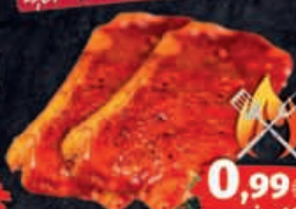
Rostbeef mariniert 1kg = 9,95€