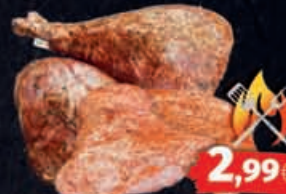
Puten Flügel oder Unterkäule mariniert, 1kg