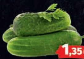
Einlegegurken HKL/Herkunft: laut Auszeichnung 1kg