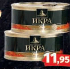
Wildlachs-Kaviar ZARENDOM 250g Dose - 100g = 4,78€