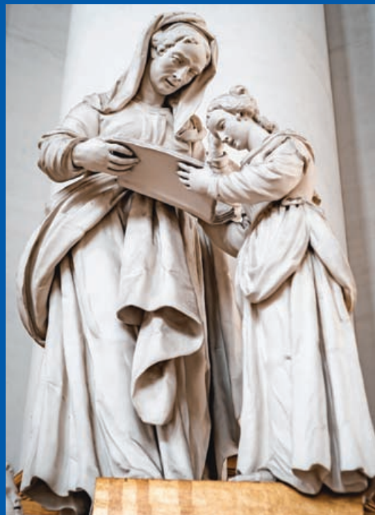
Foto: Hl. Anna, Oma von Jesus mit ihrem Kind Maria © Lars Altstadt