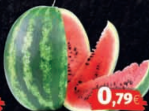
Wassermelonen Herkunft: Griechenland HKL: laut Auszeichnung 1kg