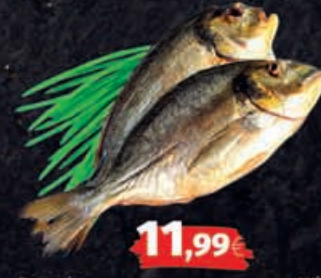
Dorade kalt- oder heißgeräuchert 1kg