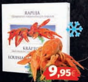
Flusskrebse, ganz tiefgefroren 1kg Packung