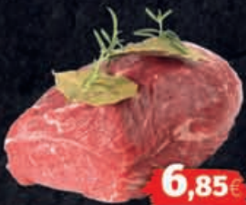
Rinder-Bug, frisch Herkunft: laut Auszeichnung 1kg