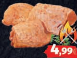
Polo Fino von Hähnchen mariniert, 1kg