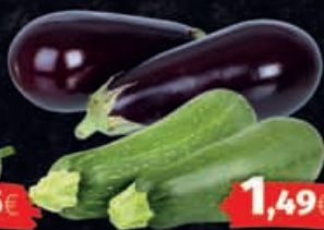
Zucchini oder Auberginen HKL/Herkunft: laut Auszeichnung 1kg