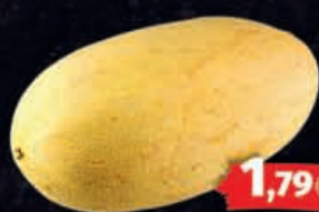
Usbekische Melone HKL: laut Auszeichnung 1kg