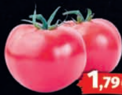
Pinktomaten HKL/Herkunft: laut Auszeichnung 1kg