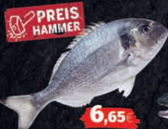
Frische Dorade Herkunft: laut Auszeichnung 1kg