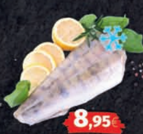
Zanderfilet tiefgekühlt 1kg