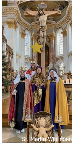
St. Martin Wiblingen