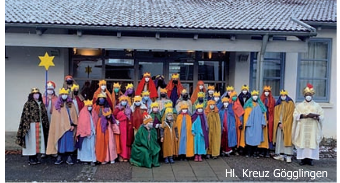
Hl. Kreuz Göggingen

Die Sternsingerteams der Seelsorgeeinheit Ulm-Basilika