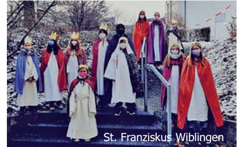
St. Franziskus Wiblingen