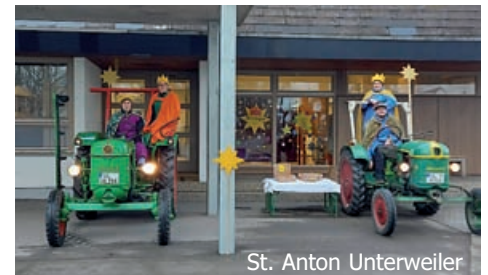
St. Anton Unterweiler