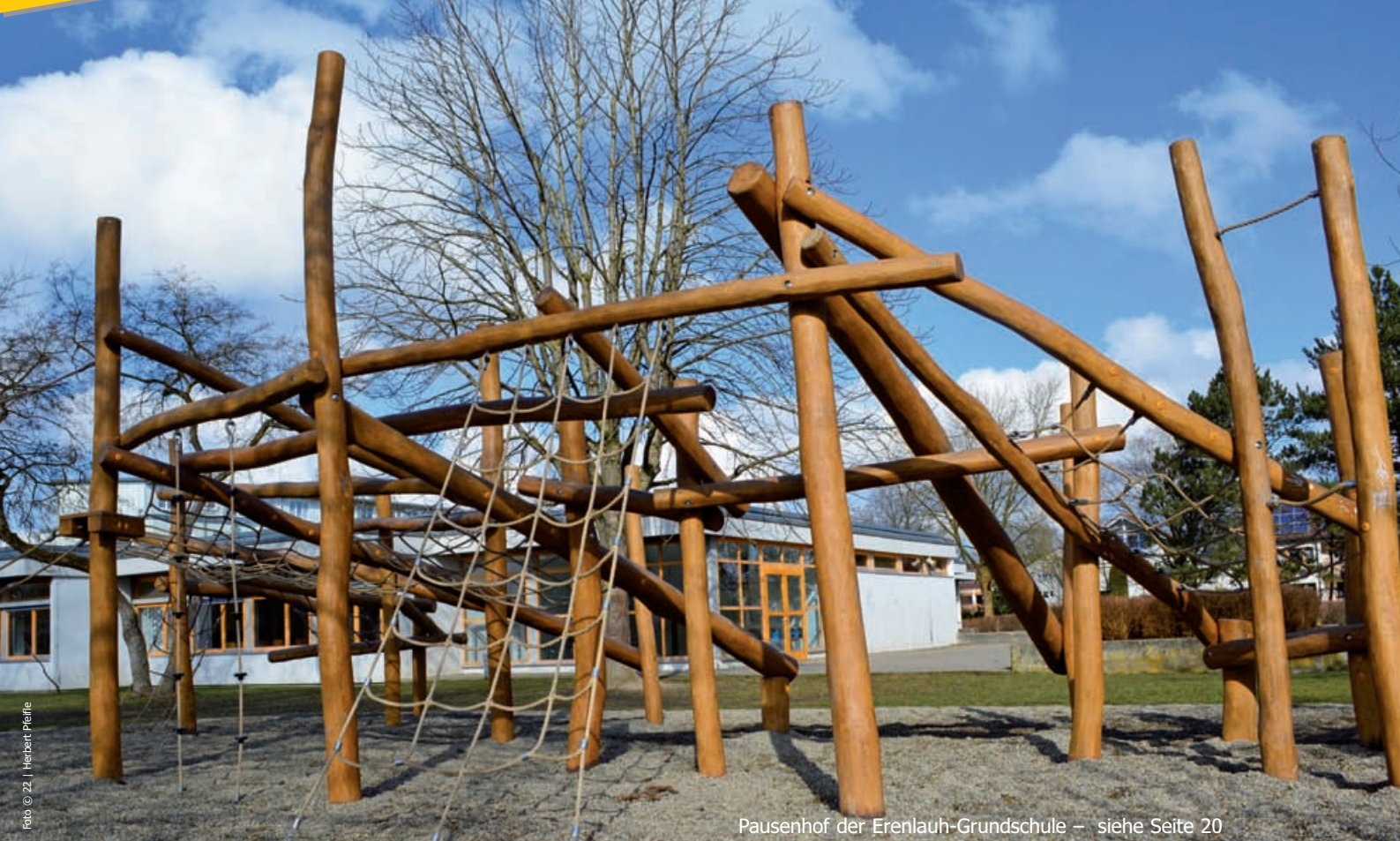
Pausenhof der Erenlah-Grundschule – siehe Seite 20

Offizielles Mitteilungsblatt der Regionalen Planungsgruppe Ulm-Wiblingen