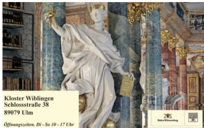
Kloster Wiblingen Schlossstraße 38 89079 Ulm