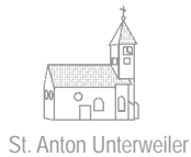
St. Anton Unterweiler