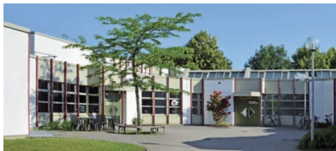
Bürgerzentrum am Tannenplatz

In den 25 Jahren seit ihrem Bestehen beschäftigte sich die RPG Wiblingen unter anderem intensiv mit Themen wie Angebote im Bürgertreff mit Beteiligung der RPG, Kommunikationsort Marktplatz, Einrichtung des Waldsportpfades im Gögglinger Wald, Neubaugebiete Eschwiesen I und II, Querspange und Argentonkreisel, Mensa und Ganztageschule, Verkehrsberuhigung, Auswahl und Ausstat-