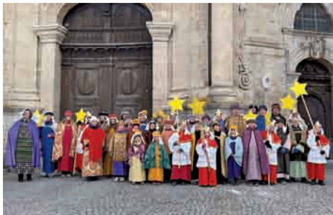
St. Martin Wiblingen