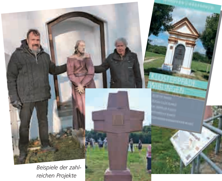
Beispiele der zahlreichen Projekte

In der Laudatio hob die Jury das vielseitige Engagement des Wiblinger Förderkreises hervor. Der Verein mit seinen rund 120 Mitgliedern hat es sich zur Aufgabe gemacht, die Glaubenszeichen auf dem Gebiet des ehemaligen Klosters Wiblingen – weitgehend auf Ulmer Gemarkung liegend – zu dokumentieren, zu erhalten und in enger Abstimmung mit den jeweiligen Eigentümern zu pflegen. Durch Mitgliedsbeiträge, Spenden sowie umfangreiche Eigenleistungen konnte so eine beeindruckende Zahl an Bildstöcken, Flurkreuzen, Kleinkapellen und anderen Kleindenkmalen als Elemente der christlich geprägten Kulturlandschaft bewahrt werden.