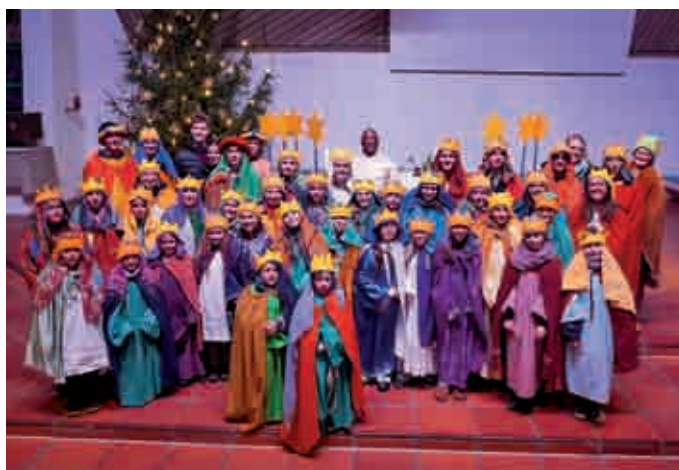
Hl. Kreuz Gögglingen und St. Laurentius Donaustetten