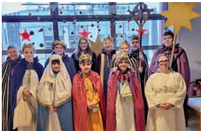
St. Franziskus Wiblingen