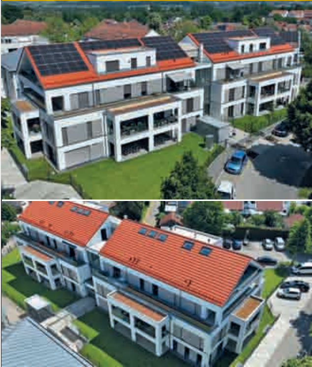
Göggingen - Donaustetten