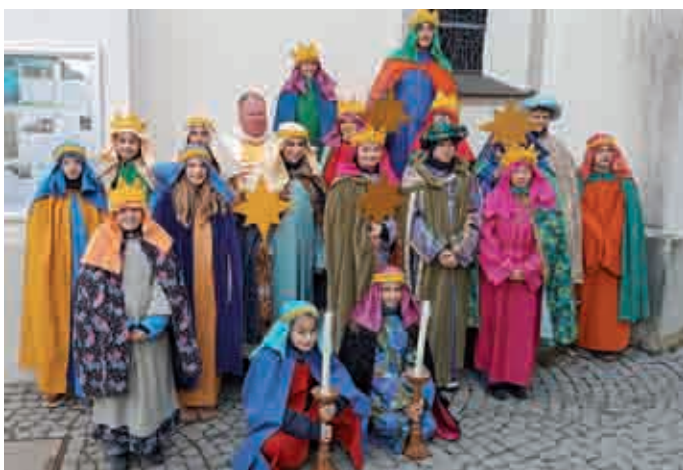
St. Anton Unterweiler