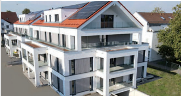
Gögglingen - Donaustetten