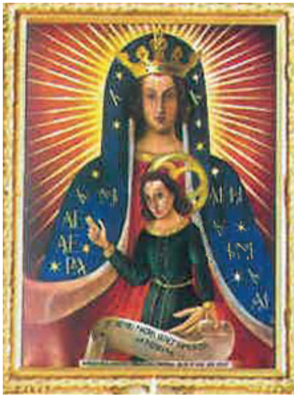
Gnadenbild „Maria vom Blut“