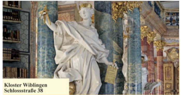
Kloster Wiblingen Schlossstraße 38