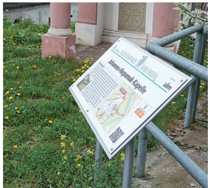
Ausführliche Infotafeln an den Objekten

Die Einweihung der Klosterpfade Wiblingen findet Anfang Juni statt. Mehr dazu in der nächsten Ausgabe von WIBLINGEN aktuell.