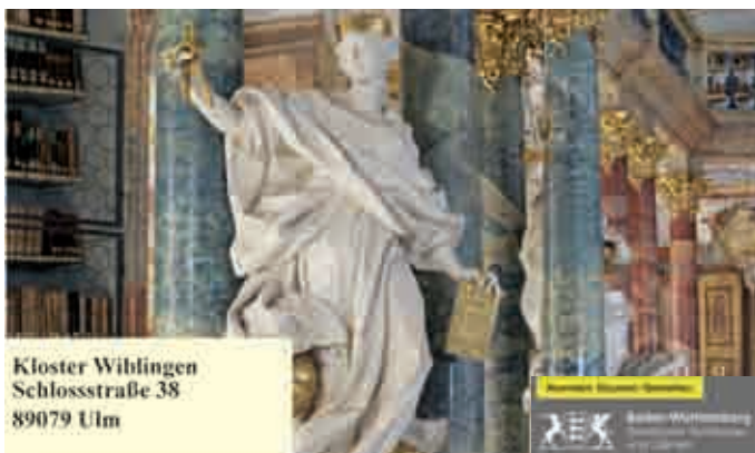
Kloster Wiblingen Schlossstraße 38 89079 Ulm