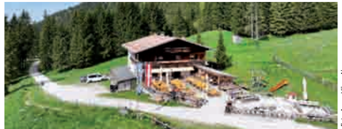
Vilser Alm

Die diesjährige Fahrt zur Bergmesse führt nach Pfronten-Steinach/Vils. Den Berggottesdienst feiern die Wanderinnen und Wanderer bei der Vilser Alm.