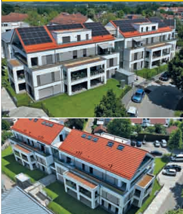
Gögglingen - Donaustetten

Neubau Erstvermietungen Bezugsfertig ab 01.07.2026!