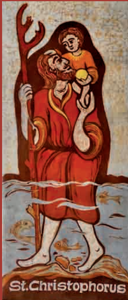
St. Christophorus-Wandteppich von 1992 im Christophorushaus in Göggingen